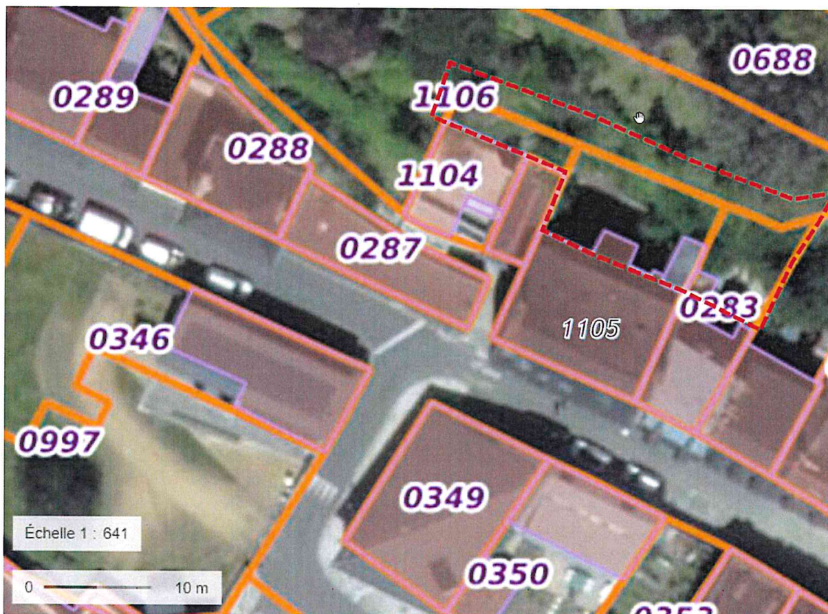
Illustration n°9 : Carte de détail et périmètre de sécurité (en rouge).

Rapport modifié du BRGM du 6 septembre 2022