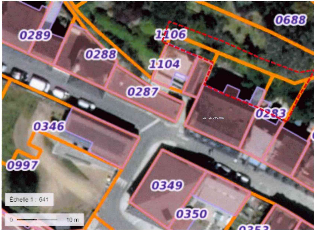
Illustration 23: Carte de détail et périmètre de sécurité (en rouge).