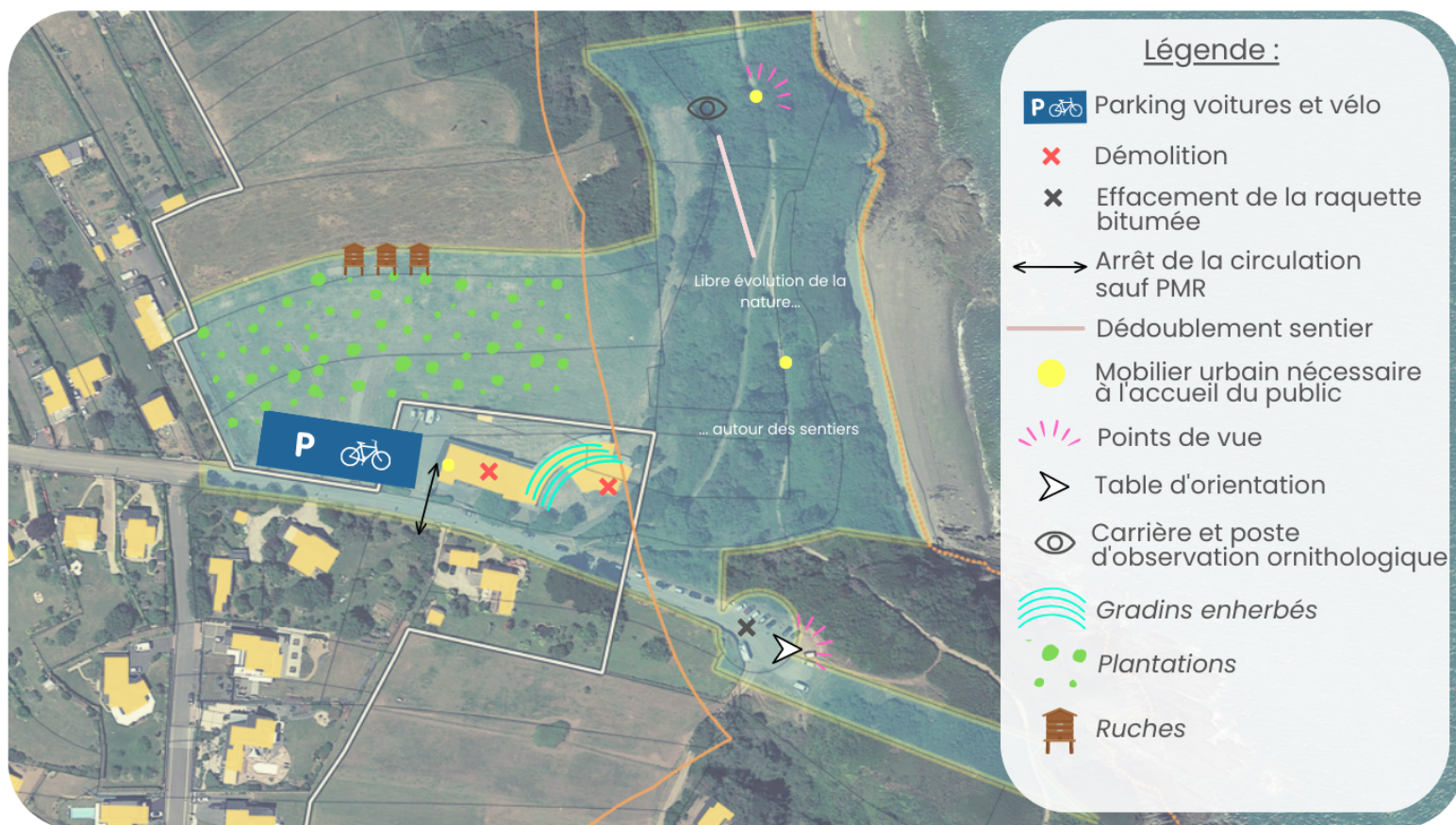
Schéma d'intention - Mars 2023